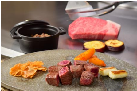
但馬 料理イメージ