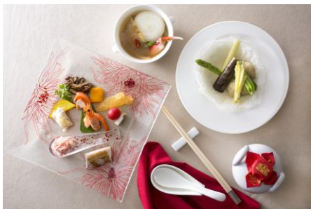
聚景園 料理イメージ