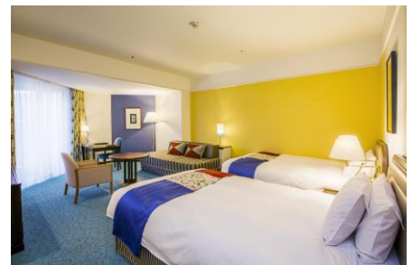
南館サウスリゾーツイン