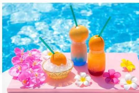
プールサイドドリンク イメージ