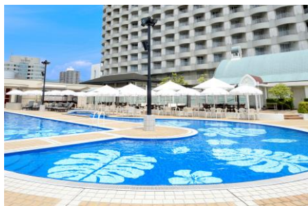
ルーフガーデンプール