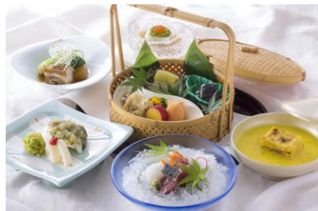
神戸 たむら 料理イメージ