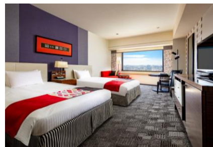
本館ミッドセンチュリーツイン