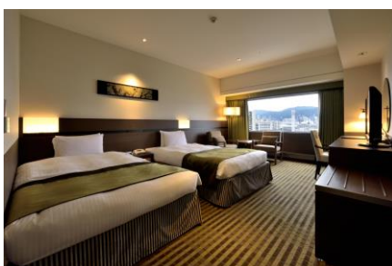
本館スーペリアツイン

[内容] 大阪・関西万博 1 日券 2 枚（※会期中いつでも 1 回入場可）、パビリオン入場特別抽選券付