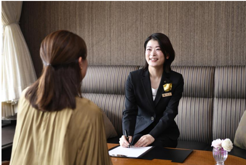
1人1人に寄り添うパーソナルサービス

ポートピアホテルはこのたび IBJ が運営する日本最大級の結婚相談所ネットワーク「日本結婚相談所連盟」と協働し、関西のホテルで初となる結婚相談所「Marriage & Life Partners Club」を開設、婚活事業へ進出いたします。